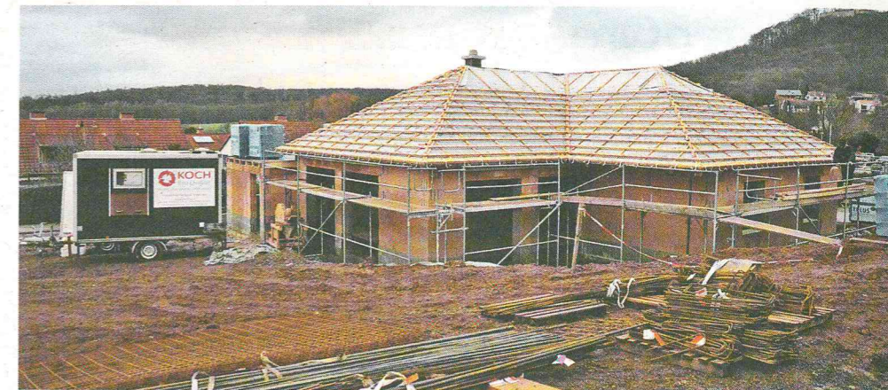
Das Gebäude entsteht in langlebiger massiver Bauweise.