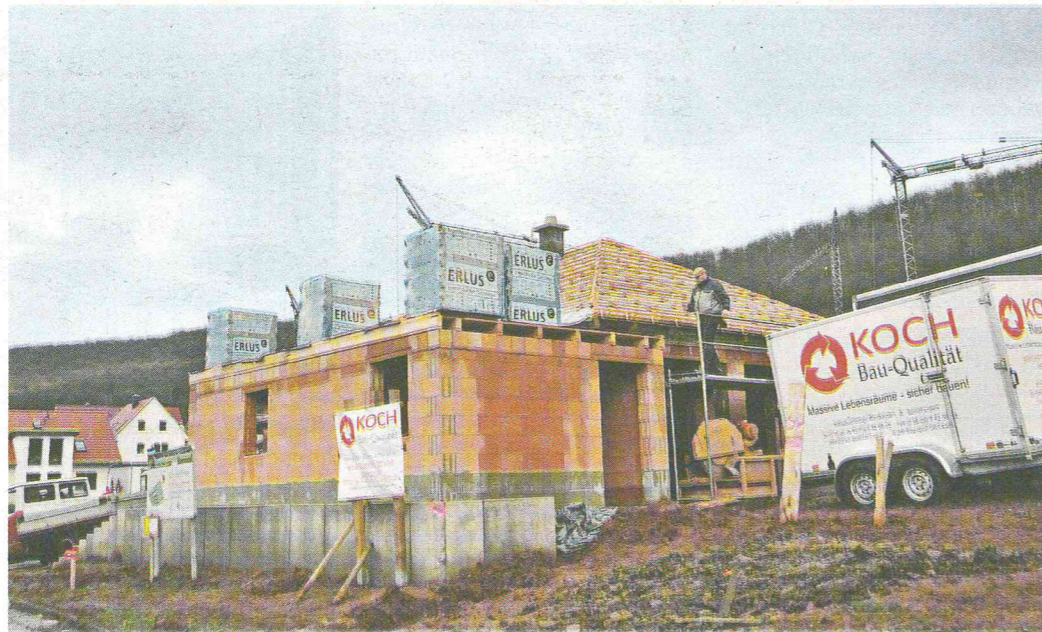
Blick auf einen Rohbau der Firma Koch Bau-Qualität in Eddigehausen.

Ein Haus sollte so gebaut werden, dass man in ihm auch noch im Alter leben kann. Das bedeutet, es sollte barrierefrei sein und über breite Türen, schwellenlose Übergänge sowie viel Bewegungsfläche im Bad verfügen. Im Erdgeschoß sollten alle notwendigen Einrichtungen vorhanden sein, so dass später kein Treppensteigen notwendig wird.